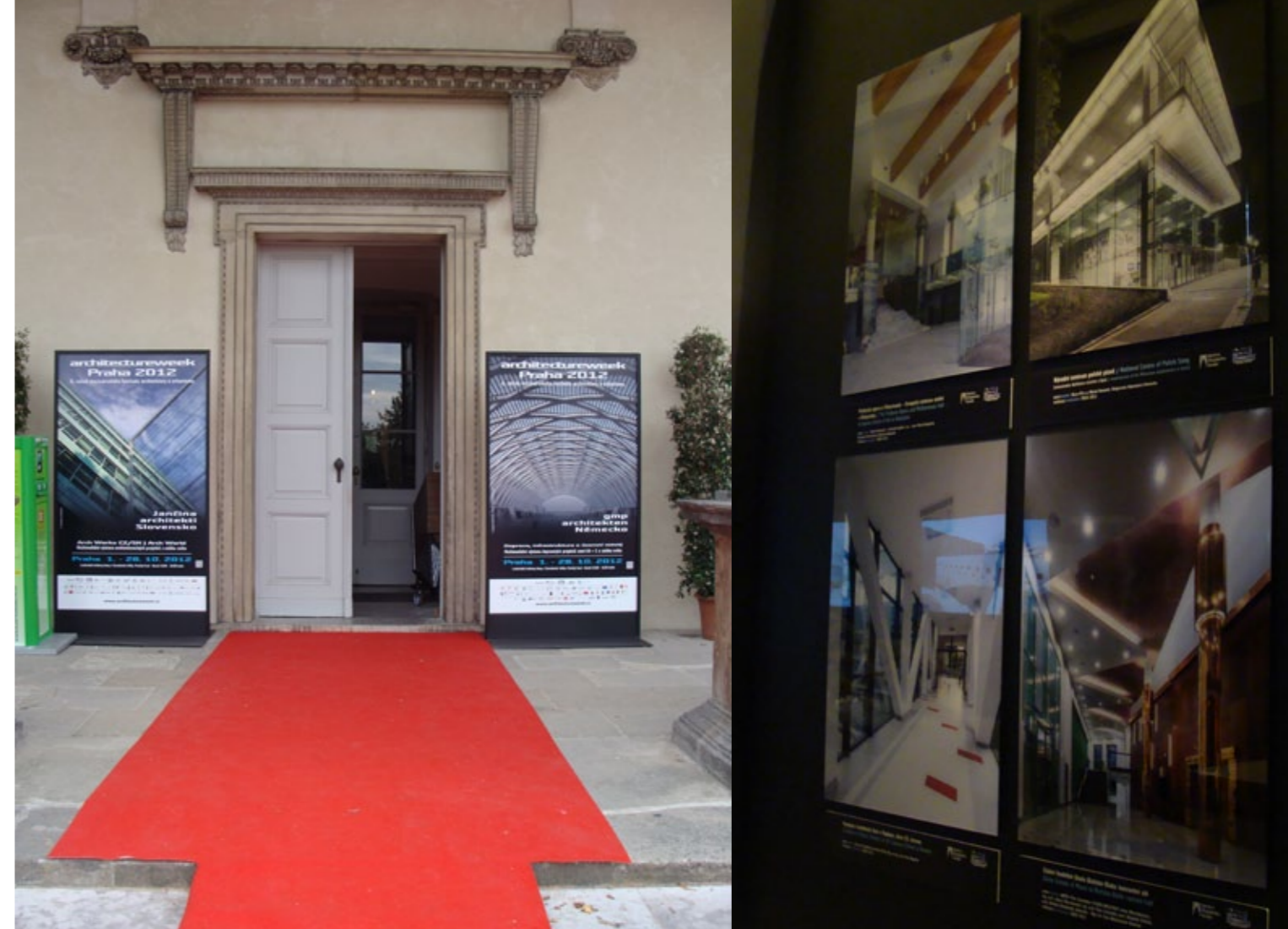
■ Festiwal Architecture Week w Pradze

Przewidywany termin zakończenia projektu: sierpień 2014 r.