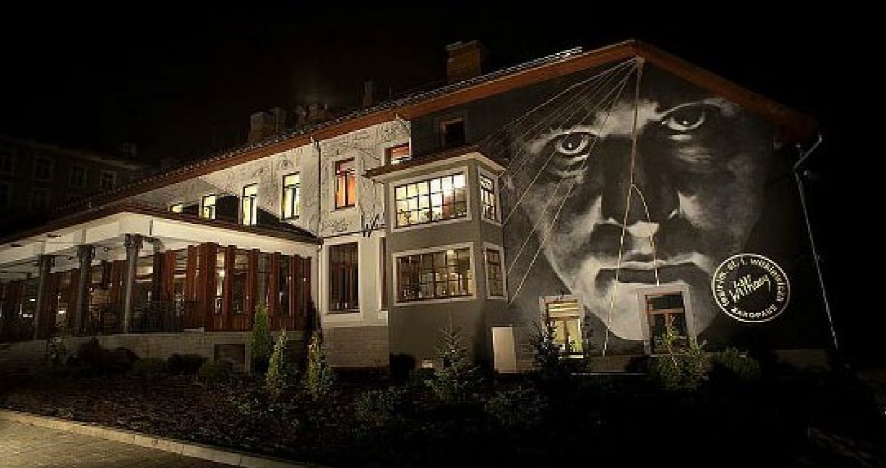
■ Duża Scena Teatru im. St. I. Witkiewicza