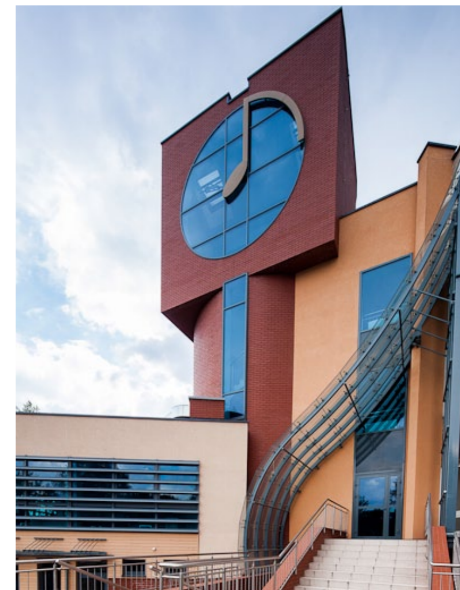
■ Zespół Państwowych Szkół Muzycznych im. M. Karłowicza w Krakowie

Całkowity koszt projektu wynosi: 23,99 mln zł, kwota dofinansowania z EFRR: 20,39 mln zł.