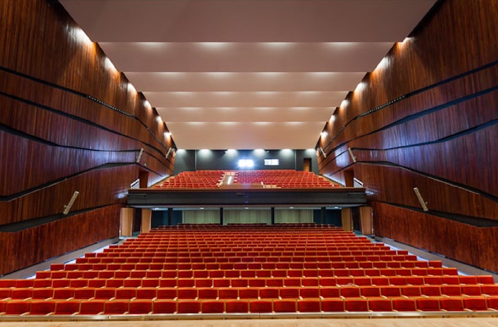
■ Filharmonia Częstochowska im. B. Hubermana