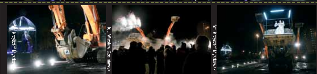
fol. Krzysztof Mysłkowski