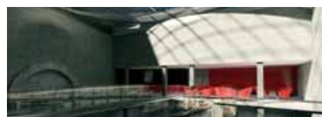
Fot. Toya Design

kompleksowa przebudowa Sali Wielkiej zamku do roli wielofunkcyjnej sali widowiskowej wyposażonej w sprzęt elektroakustyczny i multimedialny oraz niezbędne systemy techniczne.