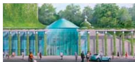
Proj. arch.: Marek Budzyński

Podlaskiej będzie miał charakter wielofunkcyjny, w którym prezentowane będą wszystkie gatunki dzieł scenicznych i koncertowych. Koncepcja projektu dotyczy również funkcji wystawienniczej – prezentacja dzieł sztuki.