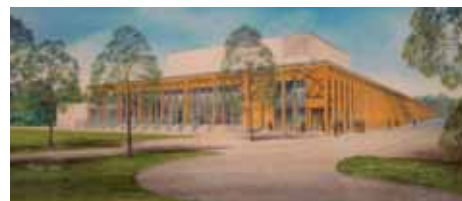
Proj. arch.: prof. dr inż. J. Grabacki, mgr inż. M. Szefer, mgr inż. A. Mor- moński, mgr inż. M. Grabiń, mgr inż. J. Zdeb, DDJM - Biuro Projektowe - arch. M. Dunikowski, arch. J. Kutnowski

kie pomieszczenia zostaną kompleksowo wyposażone. Inwestycja przyczyni się do zmniejszenia luki cywilizacyjnej poprzez wyposażenie jednej z najważniejszych instytucji kultury w wysokiej klasy obiekt.