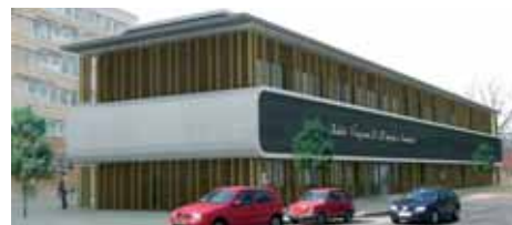
Proj. arch.: Biuro Projektowo-Badawcze MIASTOPROJEKT-BIALYSTOK

na prawidłowy odbiór dźwięku jak i zabezpieczające przed emisją hałasu. Dodatkowo zaplanowana została rozbudowa dotychczasowego budynku Szkoły, zakup instrumentów muzycznych, zakup wyposażenia budynku, sprzętu komputerowego oraz multimedialnego.