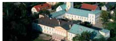
Proj. arch.: Hanna Kramarczyk - Studio Quattro

realizacji obiekt będzie pełnił funkcję ogólnodostępnego obiektu zabytkowego oraz funkcje edukacyjne i kulturowe w ramach Śląskiego Centrum Edukacji Regionalnej.