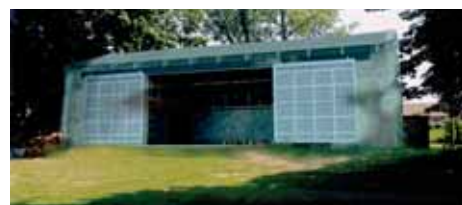
Proj. arch.: dr arch. Jerzy Uścińowicz

artystycznych, organizacji działań edukacyjnych w kompleksie pałacowym w Gardzienicach prowadzonym przez instytucję kultury będącą jedną z najbardziej znanych grup teatru eksperymentalnego na świecie.