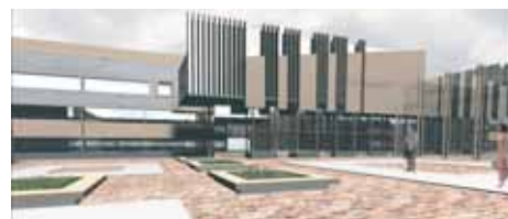
Proj. arch.: Biuro Projektowo-Badawcze MIASTOPROJEKT-BIALYSTOK

dwukondygnacyjnego budynku z podpiwniczeniem, parterem i piętrem oraz na budowie nowego budynku. Budynek ten pozwoli stworzyć ogólnokształcąca szkołę muzyczną I stopnia przy zachowaniu pomieszczeń szkoły muzycznej II stopnia.