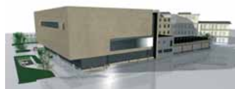
Proj. arch.: J. Aurelia Sikiewicz

elektroakustycznej, komputerowej, teatralnej i filmowej, skomunikowane z salą koncertową. Powstanie zespół sal wykładowych, sal ćwiczeniowych i dydaktycznych. Projekt przewiduje rozszerzenie istniejącej oferty edukacyjnej oraz utworzenie nowych kierunków i specjalności.