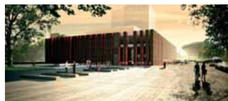
Proj. arch.: Tomasz Konior KONIOR STUDIO

administracyjnych, studia nagrań, pomieszczeń technicznych i magazynów. Głównym celem realizacji inwestycji jest wykorzystanie potencjału orkiestry oraz zachowanie jej dziedzictwa o znaczeniu światowym i europejskim dla zwiększenia atrakcyjności Polski.