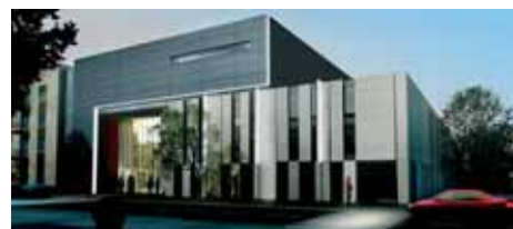
Proj. arch.: PIW-PAW Architekci Sp. z o.o., mgr inż. Arch. Jacek Śliwiński

i baletu. Dzięki zainstalowaniu wysokiej klasy aparatury będzie można wykorzystać ją również do prezentacji filmowych. Profesjonalne wyposażenie umożliwi realizację nagrań archiwalnych, dokumentalnych i płytowych oraz eksperymentalne koncerty.