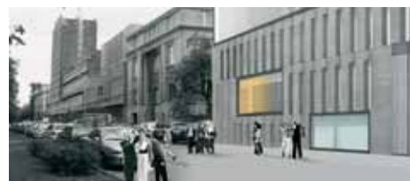
Fot. JEMS Architekcyj Sp. Z o.o

oraz modernizację niektórych elementów wewnętrznych niezbędnych do funkcjonowania starego i nowego gmachu. Ponadto zostanie wybudowany nowy, pięciokondygnacyjny budynek wraz z aulą, salami wykładowymi, pracowniami rzeźby oraz scenografii.