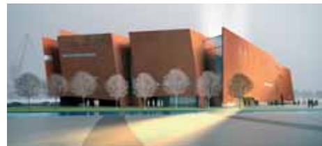
Proj. arch.: Wojciech Targowski

spacerowym prowadzącym do nabrzeża, stanowić będą jego integralną część. W Europejskim Centrum Solidarności mają się znaleźć m.in.: muzeum, sale wykładowe, archiwa. Swoją siedzibę będą tu miały także organizacje pozarządowe, m.in. Fundacja Centrum Solidarności.