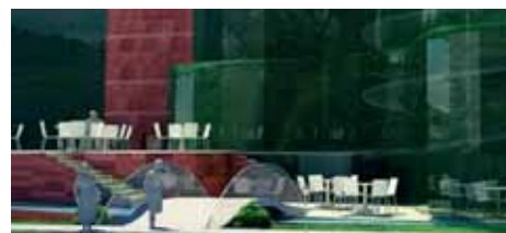
Proj. arch.: Autorska Pracownia Projektowa „ARCH-STUDIO”

infrastruktury Filharmonii Opolskiej, przez co polepszeniu ulegnie także poziom oferty. Projekt umożliwi również łączenie różnych form i gatunków artystycznych, a co za tym idzie, zwiększenie atrakcyjności koncertów poprzez wykorzystanie multimedialnych.