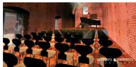
Fot. ©Jarosław Grzegory & Partnerzy Architekci

wewnętrzne, zagospodarowanie terenu – remont i modernizacja tarasu zachodniego oraz zakup wyposażenia, związanego z przygotowaniem nowoczesnej ekspozycji, wsparciem multimedialnymi systemami zarządzania zwiedzaniem.