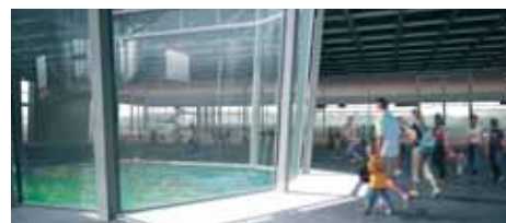
Proj. arch.: rar2_labarch kubec+gilner, oprac. graf.: dots

i świecie. Kluczowym elementem służącym wypełnianiu misji CNK będzie ekspozycja składająca się m.in. ze światowej klasy ekspozycji artystycznych inspirowanych nauką. Dopełnieniem ekspozycji będą sale laboratoryjne i wykładowe.